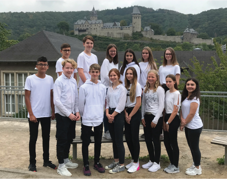
Das Team von suba duba